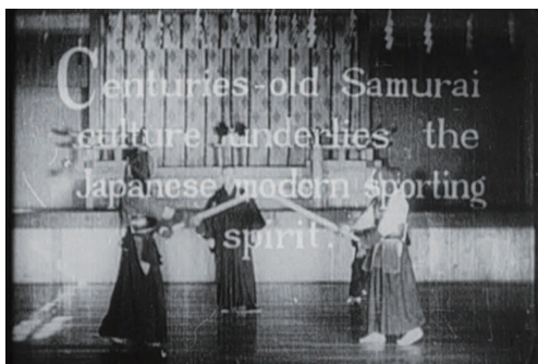
『Japan Pictorial No.4 SPORTING JAPAN / スポーツ日本』