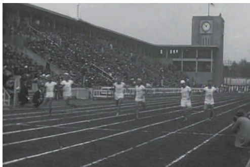
『第五回明治神宮体育大会 昭和四年秋』