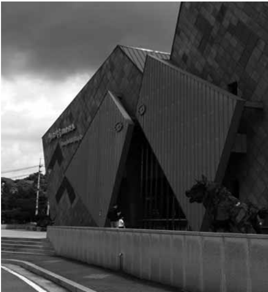
写真6 清道テーマパーク 外部 (1)