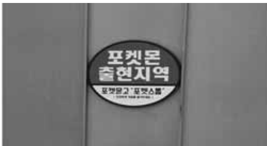
[ポケモンGO] ポケモン出現場所 ネットゲームの産業を利用した宣伝

競技場と同じ団地にあるテーマパークは、ソ・サウムについての歴史的資料を中心に、ソ・サウムを行う牛の餌、角の形、試合技術、トレーニング方法などソ・サウムが理解できるように展示されている。その中には、ソ・サウムが正々堂々な「民俗動物スポーツ」であることをアピールするアニメ(20分程度)が上映されており、これは動物