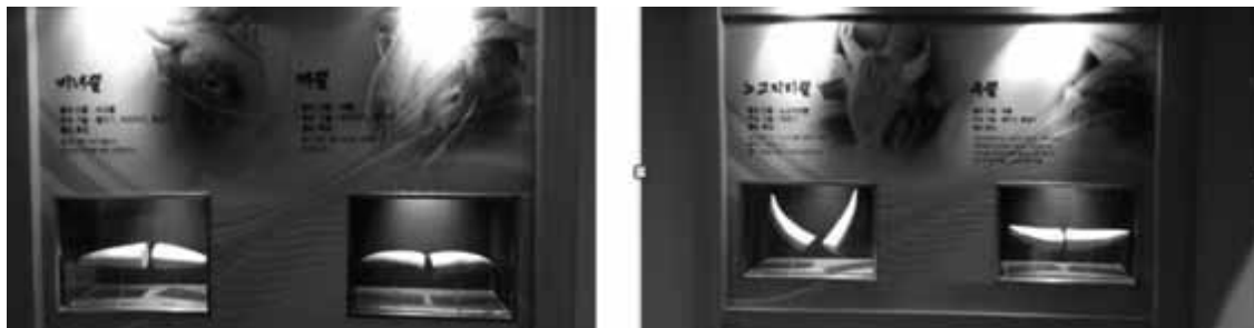
写真10 角の形による技術の特徴 (テーマパーク内部2)