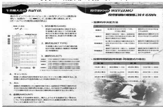
写真5 投票(牛券)方法の案内(日本語)