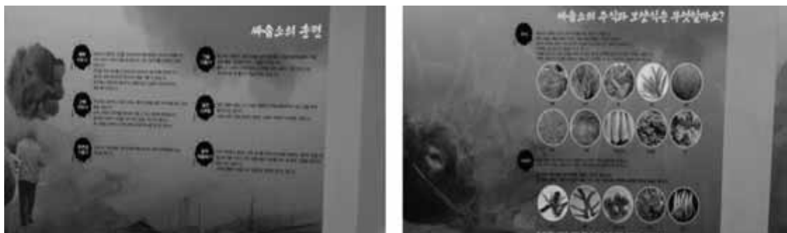
写真11 牛のトレーニング方法(左)と餌の説明(右) (テーマパーク内部3)

を戦わせることを批判する今の風潮を意識し、ソ・サウムに対するイメージの改善を目的とするものであると見られる。