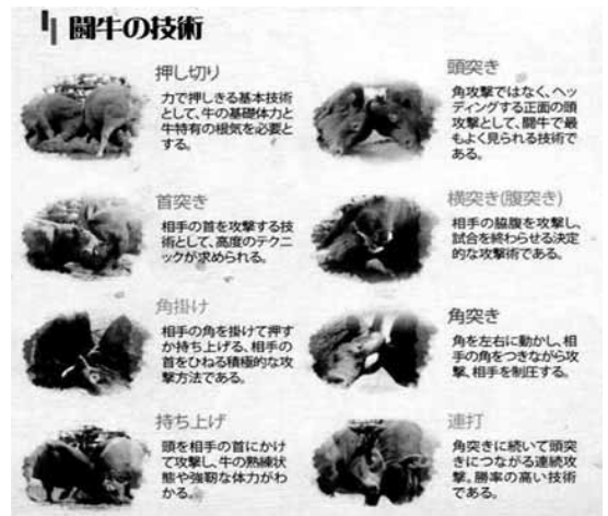
写真9 競技における8つのわざ