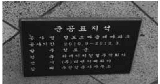
竣工の碑 工事期間：2010.9 - 2012.3 発注：(株)YH建設 監理：ウジン建築事務所