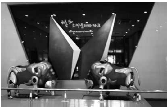
写真8 ロボットソ・サウム 実際に戦う牛の3/2の大きさ。 「韓国ロボット融合研究所」が製作、8つのわざを再現。 (テーマパーク内部1)