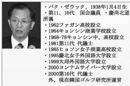
表2 パク・ゼウック議員のプロフィール

1999年文化観光部から指定された韓国のトップ10地域文化観光祭りのソ・サウムを2001年法案発議 伝統民俗文化の保存と伝承, 地域の観光と畜産復興を目標, 全国的なレジャー文化志向