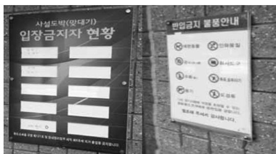
写真3 入場禁止者と禁止物のリスト